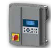
Painel de Comando Interativo SMART